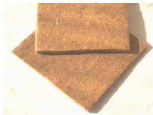
GEOTEXTIL DE FIBRAS