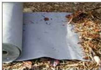
GEOTEXTIL DE POLI- PROPILENO